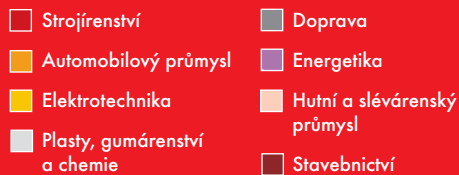
Typologie návštěvníka MSV